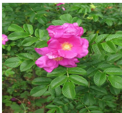
北見市の花(ハマナス)

期 日 平成27年11月28日（土）、29（日） 会 場 道立北見体育センター 主 管 網走地区サッカー協会 北見サッカー協会 網走地区フットサル連盟